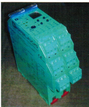
Рисунок 1 - Внешний вид барьера искрозащиты серии К

Внешний вид преобразователей представлен на рисунке 1.